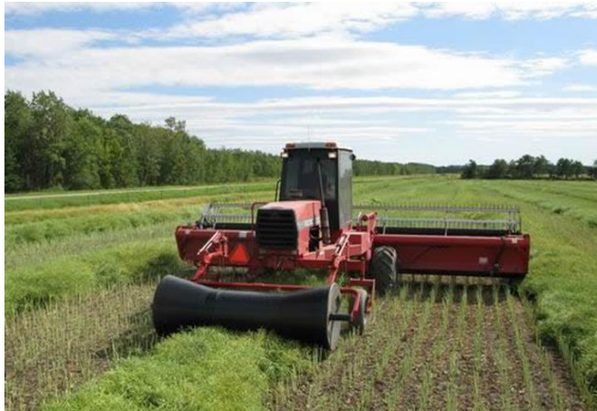
شکل ۱- برداشت غیر مستقیم کلزا با سواتر و غلطک صاف کننده ردیف

زمین بلند کرده و به داخل کمباین هدایت می‌کند و واحدها و اجزا داخلی کمباین، غلاف‌ها را از دانه محصول جدا خواهند نمود.