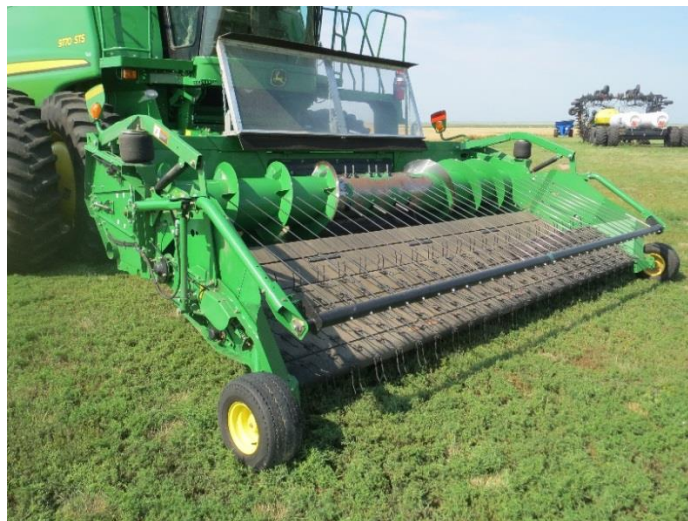
شکل ۲- هد پیکاپ متصل به کمباین برای برداشت غیر مستقیم (دو مرحله‌ای) کلزا

این روش عمدتاً برای مناطق خشک و گرم کشور با اعمال مواد بازدارنده‌ی رشد توصیه شده است. ولی در مناطق با رطوبت نسبی بالا در هنگام برداشت محصول، این روش توصیه نمی‌گردد زیرا بعد از مرحله اول، زمانیکه محصول از ساقه برش می‌خورد و روی زمین ردیف می‌گردد باید رطوبت هوا زیاد نباشد تا طی چند روز محصول خشک شده و رطوبت آن از ۳۰ درصد به حدود ۱۵-۱۲ درصد تنزل یابد. اما همانطور که گفته