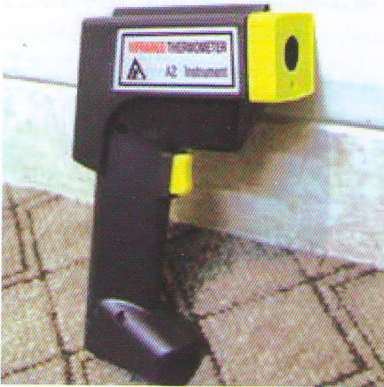
شکل ۲- دماسنج مادون قرمز دستی