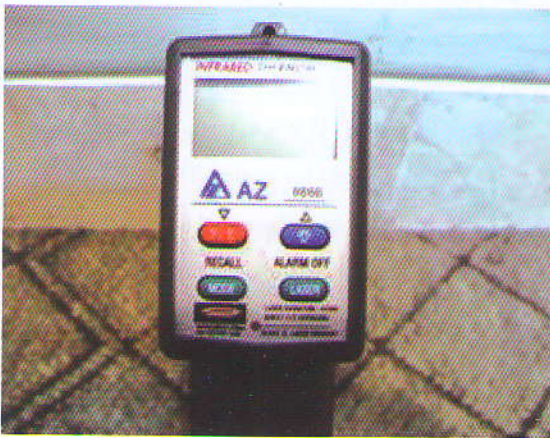
شکل ۳- نمایشگر دماسنج مادون قرمز دستی

برای یک رقم یا یک منطقه خاص به دست آورد.