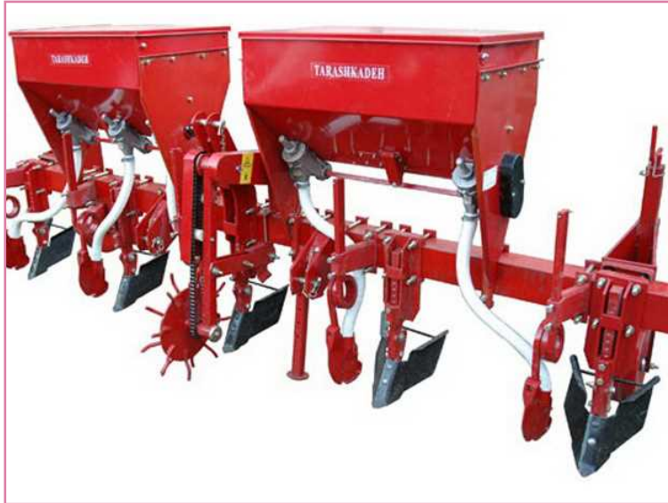
شکل ۷- کودکار- فاروئر

وسایلی که تاکنون توضیح داده شدند، عملیاتی همچون سله شکنی خاک، دفع علف های هرز بین ردیف ها، کوددهی و خاک دهی پای بوته را انجام می دهند. عمق کار خاک ورزهای به کاررفته در این نوع کولتیواتورها عمدتاً سطحی (۵ تا ۱۰ سانتی متر) است. در ادامه بحث، خاک ورزهای بین ردیفی با گاوآهن های قلمی و خاک ورزهای دوار (رتیواتور ردیفی) بررسی می شوند که قادر به کار در عمق های حدود ۲۰ سانتی متر با شدت عمل بیش تر و در نتیجه نرم کردن بهتر خاک اطراف ریشه چغندر قند هستند.