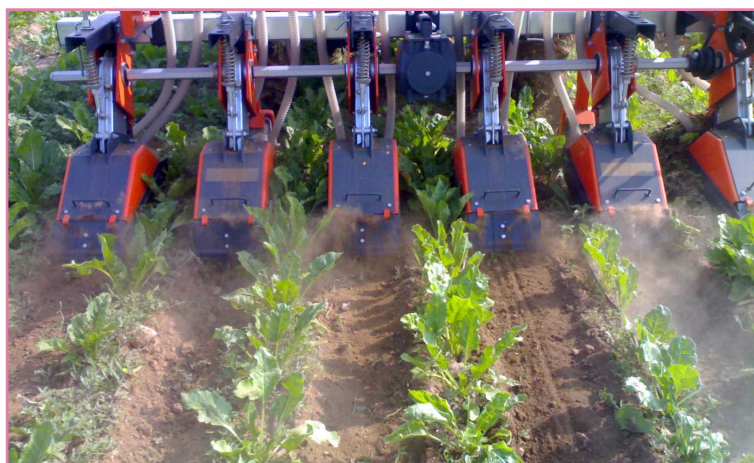
شکل ۱۲- وضعیت علف‌های هرز با روتیواتور بین ردیفی