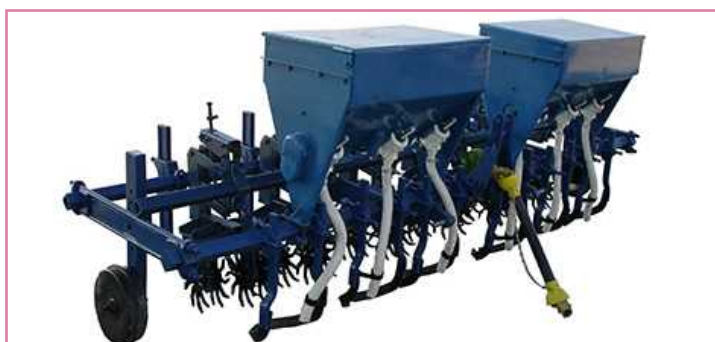
شکل ۶- کولتیواتور تیغه شمشیری مجهز به کودریز و تیغه های چرخان ستاره ای (انجام عملیات دفع علف های هرز، کوددهی، سله شکنی، شکل دهی جویچه ها و خاک دهی پشته ها به طور هم زمان)