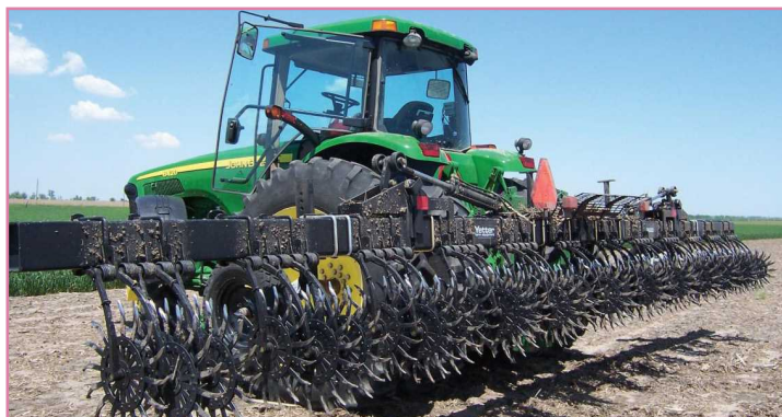
شکل ۴- کولتیواتور ستاره ای (لیلستون) (انجام عملیات دفع علف های هرز و سله شکنی سطحی خاک)