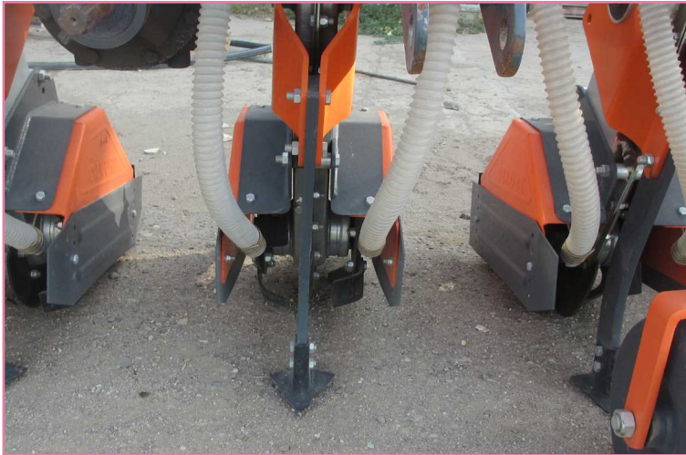
شکل ۸- روتیواتور ردیفی مجهز به کودریز و خاک‌ورز (انجام عملیات دفع علف‌های هرز، کوددهی و خاک‌ورزی بین ردیف‌ها)

این دستگاه متشکل از روتیواتور بین ردیفی، خاک ورز مجهز به تیغه پنجه‌غازی و کودریز است که هم‌زمان عملیات مبارزه با علف‌های هرز، خاک‌ورزی بین ردیفی و کوددهی را انجام می‌دهد (شکل ۸). توان مورد نیاز واحد روتیواتور این دستگاه از طریق محور دهی تراکتور (PTO) تأمین می‌شود. این وسیله کارایی قابل قبولی در مبارزه مکانیکی با علف‌های هرز دارد (در صورتی که مزرعه دارای علف‌های هرز زیاد باشد، توصیه می‌شود تراکتور با سرعت کم حرکت کند) و با توجه به داشتن خاک‌ورز با عمق کار مناسب قابلیت کار تا عمق ۲۰ سانتی‌متری خاک را دارد. تنها عیب این وسیله واحد روتیواتور آن است که باعث پودرشدن خاک سطحی و ایجاد گرد و غبار، به خصوص در شرایطی که خاک خشک است، می‌شود (شکل ۹). بنابراین مناسب‌ترین زمان استفاده از این دستگاه موقعی است که خاک مقداری رطوبت داشته باشد. همچنین با به‌کارگیری این وسیله هیچ‌گونه خسارتی به محصول در عمق ۲۰ سانتی‌متر مشاهده نشد. فاصله واحدهای خاک‌ورز این دستگاه برای استفاده در زراعت‌های دیگر مانند ذرت قابل تنظیم است.