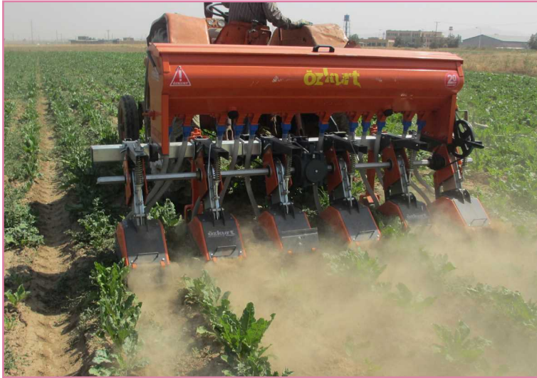
شکل ۹- پودرشدن خاک و ایجاد گرد و غبار با روتیواتور ردیفی