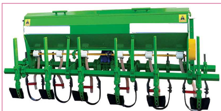
شکل ۵- کولتیواتور تیغه شمشیری مجهز به کودریز و فاروئر (انجام عملیات دفع علف های هرز، کوددهی، شکل دهی جویچه ها و خاک دهی پایه بوته ها به صورت هم زمان)