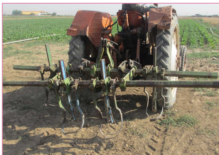
شکل ۱۱- محل قرارگیری بازو و تیغه قلمی