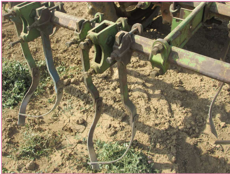
شکل ۳- کولتیواتور تیغه شمشیری (انجام عملیات دفع علف‌های هرز و سله‌شکنی سطحی خاک)