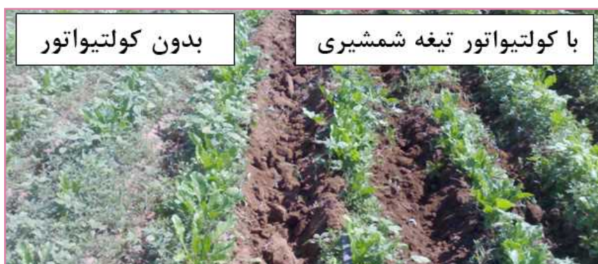
شکل ۱- وضعیت خاک با و بدون کولتیواتور بین ردیفی (تیغه شمشیری)

کولتیواتورهای ردیفی از جمله وسایلی هستند که به طور وسیع در زراعت چغندر قند استفاده می‌شوند. کاربرد عمده آن‌ها برای سله شکنی خاک و مبارزه مکانیکی با علف‌های هرز با هدف کاهش مصرف سموم شیمیایی است (شکل ۱). با سله شکنی خاک، هوادهی به خاک تسریع می‌شود و اکسیژن بیش‌تری در اختیار گیاه قرار می‌گیرد. همچنین با حذف لوله‌های مویین تبخیر از سطح خاک به خصوص در فصل‌های گرم کاهش می‌یابد (شکل ۲). اغلب کولتیواتورها در شرایطی که هوا گرم و خاک سطحی خشک باشد، مؤثرتر هستند؛ چرا که در این شرایط، علف‌های هرزی که از ریشه درآورده شده‌اند، قبل از تولید ریشه‌های جدید خشک می‌شوند. بنابراین عملیات کولتیواتورزنی زمانی بهترین نتیجه را می‌دهد که خاک خشک و هوا گرم باشد.