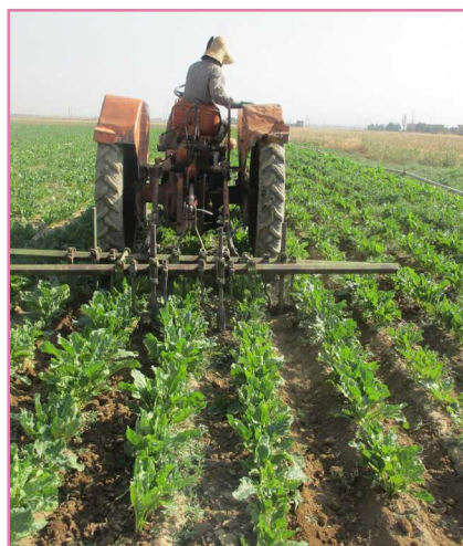
شکل ۱۰- عملیات خاک ورزی بین ردیفی با کولتیواتور تیغه شمشیری مجهز به بازو و تیغه‌های قلمی