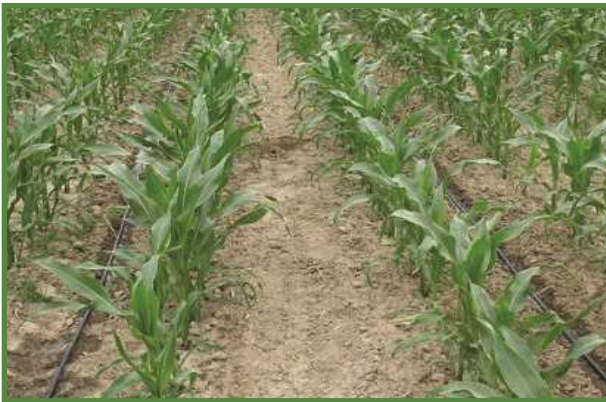
شکل ۱۸- آرایش یک نوار تیپ برای دو ردیف کاشت

از راه‌های کاهش هزینه‌های سیستم آبیاری، کاهش مقدار مصرف لوله‌های تیپ است. برای این منظور در آرایشی خاص از سیستم آبیاری می‌توان از یک ردیف نوار آبیاری برای آبیاری دو ردیف کاشت استفاده کرد. بنابراین اگر به‌جای در نظر گرفتن یک ردیف نوار آبیاری برای هر ردیف محصول (یک نوار آبیاری دو ردیف را آبیاری کند) ۵۰ درصد در هزینه‌های نوارهای آبیاری صرفه‌جویی خواهد شد. علاوه بر آن این آرایش سبب صرفه‌جویی در آب مصرفی نیز خواهد شد. شکل ۱۸ آرایشی را نشان می‌دهد که هر ردیف نوار آبیاری دو ردیف کاشت را آبیاری کرده و شکل ۱۹ آرایشی را نشان می‌دهد که هر ردیف نوار آبیاری یک ردیف کاشت را آبیاری می‌کند.