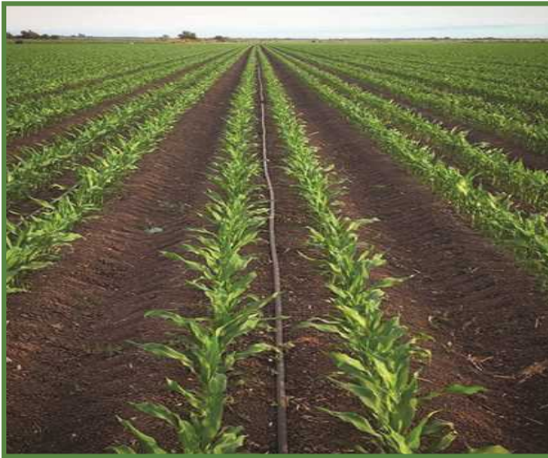
شکل ۱۷- طول نوارهای آبیاری