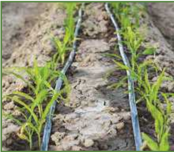
شکل ۲۰- آرایش نوار تیپ در شرایط آب و خاک شور

کشت و سیستم لوله‌های تیپ سبب می‌شود که در موقع آبیاری، آب آبیاری نمک‌ها را به خارج از منطقه ریشه جابه‌جا کند. بنابراین شوری منطقه ریشه کاهش خواهد یافت و مقداری از زیان شوری کم خواهد شد.