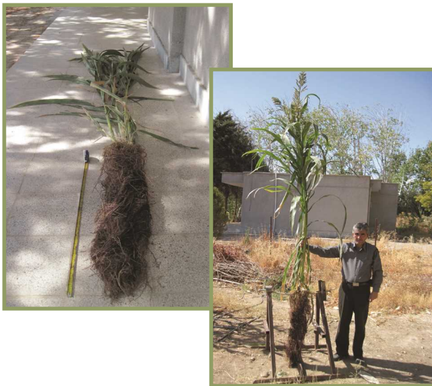
شکل ۲- سیستم ریشه‌افشان و گسترده در سورگوم

واریشه‌های در اکثر مناطق ایران با استفاده از ارقام و واریته‌های مناسب و رعایت تاریخ کاشت قابل کشت است، از جمله کرج، اراک، ورامین، شاهرود، مشهد، نیشابور، بیرجند، سیستان و بلوچستان، هرمزگان، بوشهر، کرمان، یزد، شیراز، اصفهان، خرم آباد، کرمانشاه، ارومیه، میانه، قزوین، زنجان، مغان، گیلان، گرگان، ساری و سمنان.