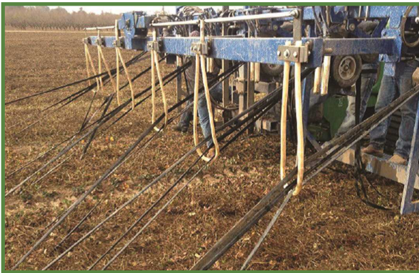
شکل ۲۳- جمع‌آوری مکانیزه نوار آبیاری قطره‌ای

در پایان فصل آبیاری و بعد از برداشت محصول، نوارهای آبیاری باید از زمین جمع‌آوری شوند. جمع‌آوری نوارها به دو روش دستی و مکانیزه امکان‌پذیر است. در زمان جمع‌آوری نوارها از داخل زمین باید طوری برنامه‌ریزی کرد که رطوبت خاک مناسب باشد تا لوله‌ها بدون پاره‌شدگی و به‌سهولت از داخل زمین جمع شوند. جمع‌آوری نوارهای آبیاری باید با دقت صورت گیرد؛ چون نوارهای آبیاری از مواد پلی‌اتیلن هستند و در طبیعت تجزیه‌ناپذیرند. بنابراین باقی‌ماندن این نوارها در خاک سبب آلودگی شدید خاک‌ها می‌شود (شکل ۲۳).