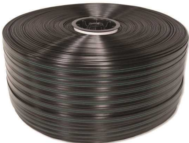
شکل ۶- نوارهای تیپ به صورت رول