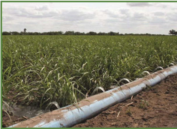
شکل ۴- روش شیاری در زراعت سورگوم