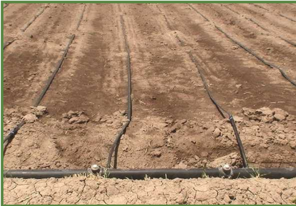
شکل ۱۶ - فاصله لوله‌های تیپ

تعیین فاصله خطوط لوله‌های تیپ از یکدیگر بسیار مهم است. فاصله لوله‌های تیپ تابعی از نحوه کاشت محصول و فاصله ردیف‌های کشت از یکدیگر است. البته بافت خاک مزرعه نیز در آن دخیل است. فاصله نوارهای تیپ از همدیگر در حقیقت معادل با فاصله بین محل‌های اتصال تیپ به لوله نیمه‌اصلی (آبده) یا فاصله نصب بست‌های ابتدایی بر روی لوله نیمه‌اصلی (آبده) است. فاصله لوله‌های آبیاری تیپ از همدیگر و همچنین فاصله روزنه‌های روی لوله (قطره‌چکان‌ها) وابسته به بافت خاک مزرعه است (شکل ۱۶).