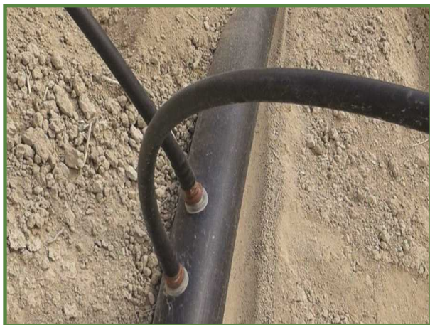
شکل ۱۰- نحوه اتصال لوله ۱۶ به لوله آبدۀ در زیر خاک