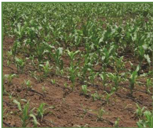
شکل ۱۹- آرایش یک نوار تیپ برای هر ردیف کاشت