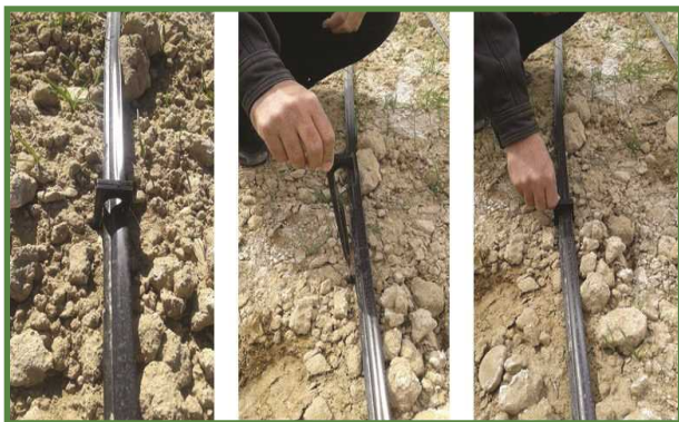
شکل ۱۵- مهاری نوارهای آبیاری با گیره در روی زمین

باد براحتی لوله‌های تیپ را به دلیل سبک بودن جابه‌جا می‌کند. در مناطق بادخیز، باد مشکلات زیادی را برای این روش ایجاد می‌کند. بنابراین در زمان پهن کردن، لوله‌ها یا باید در زیر خاک مدفون شوند (در عمق حدود ۵ سانتی‌متر) یا به وسیله گیره‌های مخصوص مهاری شوند. شکل ۱۵ نحوه مهاری کردن نوارهای آبیاری را با گیره‌های مخصوص در روی زمین نشان می‌دهد.