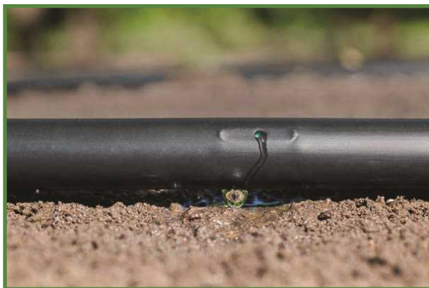
شکل ۹- نوار آبیاری پلاک‌دار