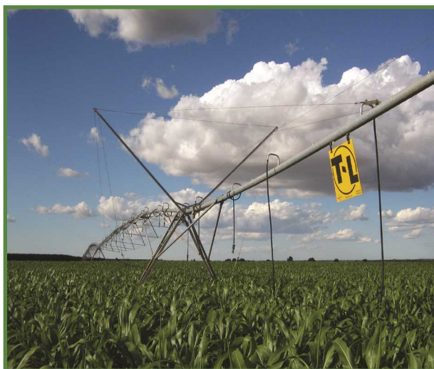
شکل ۳ - روش بارانی در زراعت سورگوم