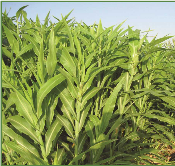
شکل ۱ - مزرعه آزمایشی سورگوم علوفه‌ای

تا ۷۵۰۰ مترمکعب در هکتار متغیر است. سورگوم با شرایط آب‌وهوای ایران بویژه مناطق گرم و خشک و معتدل، سازگاری خوبی دارد. این گیاه در مقایسه با ذرت، سیستم ریشه‌ای افشان خیلی وسیعی دارد که در حجم زیادی از خاک نفوذ کرده و رطوبت بیشتری را جذب می‌کند. شکل ۱ مزرعه آزمایشی سورگوم و شکل ۲ سیستم ریشه قوی و گسترده این گیاه را نشان می‌دهد.