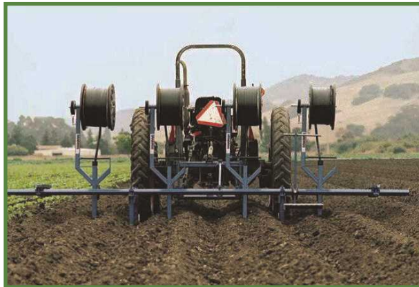
شکل ۲۲- نصب مکانیزه نوار آبیاری قطره‌ای