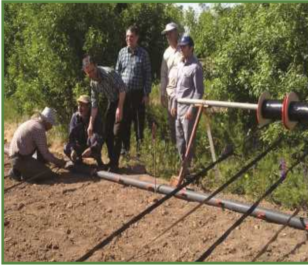
شکل ۲۱- نصب دستی نوار آبیاری قطره‌ای