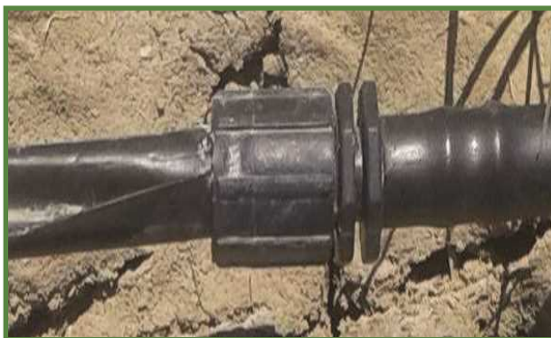
شکل ۱۲- نحوه اتصال نوارهای تیپ به لوله ۱۶

لوله‌های تیپ را می‌توان به‌طور مستقیم با اتصال مخصوص آن نیز به لوله آبدۀ وصل کرد. همچنین در جاهایی که نیاز به جابه‌جایی لوله‌های آبدۀ باشد می‌توان آن‌ها را در روی خاک قرار داد. شکل ۱۳ نحوه اتصال مستقیم نوارهای تیپ به لوله آبدۀ را نشان می‌دهد. در شکل ۱۴ لوله آبدۀ در روی خاک قرار گرفته است.