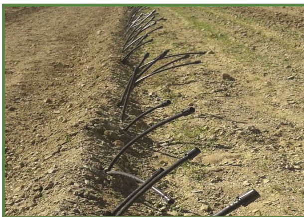
شکل ۱۱- لوله‌های ۱۶ آماده برای اتصال به نوارهای تیپ (مدفون شده در زیر خاک)