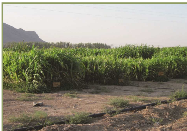
شکل ۱۴- لوله آبد در روی زمین