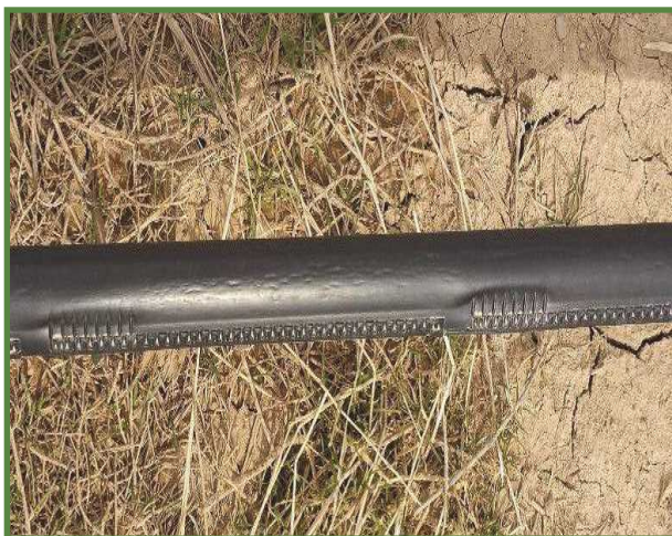
شکل ۸- نوار آبیاری درزدار (زیبی)