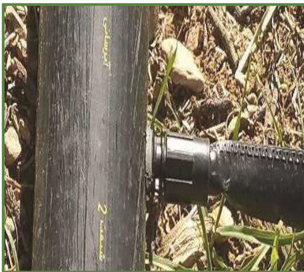
شکل ۱۳- نحوه اتصال مستقیم نوارهای تیپ به لوله آبد