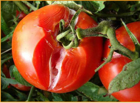
شکل ۱۹- فساد ترش میوه گوجه فرنگی