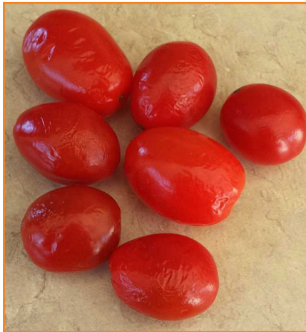
شکل ۱۵- نگهداری گوجه فرنگی در رطوبت پایین که به ایجاد چروکیدگی منجر می‌شود.

گوجه فرنگی حاوی درصد بالایی آب است و به پژمردگی پس از برداشت حساس است. بیش تر کاهش آب میوه از طریق زخم‌ها یا هرگونه ترک موجود در پوست اتفاق می‌افتد. چروکیدگی میوه حتی با کاهش ۳ درصد آب محصول قابل رؤیت است (شکل ۱۵). مقدار پژمردگی بستگی به دما، رطوبت نسبی و طول مدت نگهداری دارد. توجه داشته باشید که باید از ایجاد هوای کاملاً اشباع که دارای ۱۰۰ درصد رطوبت نسبی است خودداری کرد؛ زیرا باعث خیس شدن سطح گوجه فرنگی‌ها می‌شود و سبب تحریک رشد کپک‌های سطحی و فساد قارچی در ناحیه زخم‌ها می‌شود.