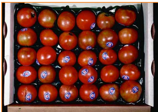
شکل ۱۳- استفاده از کاغذ یا ضربه گیر برای کاهش تأثیرات ناشی از سایش