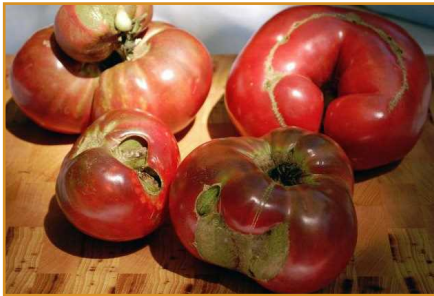
شکل ۱۰- میوه‌های با شکل نامعمول

همچنین میوه‌ها باید شکل یکنواخت مربوط به آن رقم را داشته باشند. میوه‌های بد شکل یا در اصطلاح صورت گربه‌ای ۱ باید جدا شوند و برای عرضه و به ویژه به منظور صادرات بسته بندی نشوند (شکل ۱۰).