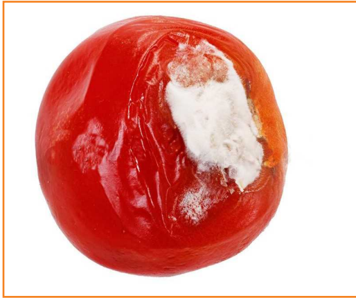
شکل ۲۰- مراحل پیشرفته فساد اسکروتیوم روی میوه رسیده گوجه فرنگی

دمای بهینه برای پیشرفت این بیماری حدود ۳۰ درجه سانتی گراد است. نگهداری میوه در دمای ۱۰ درجه سانتی گراد فساد پس از برداشت را به حداقل می رساند؛ زیرا قارچ ها در این دما رشد بسیار کمی دارند.