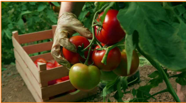
شکل ۴- روش جداسازی گوجه فرنگی از بوته

شست به سمت بالا بکشند و انگشت اشاره به سمت ساقه فشار داده شود (شکل ۴). سپس ساقه باید به دقت پیش از گذاشتن میوه در جعبه برداشته شود تا از ایجاد زخم روی میوه ممانعت شود.