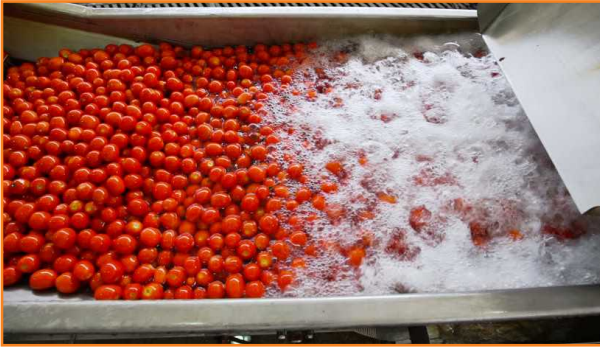
شکل ۵- تانک شست و شو و ضد عفونی گوجه فرنگی

با استفاده از نوارهای تست کاغذی یا دستگاه های اندازه گیری قابل حمل کنترل شود (شکل ۵).