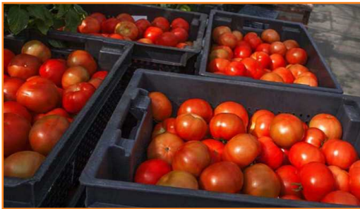
شکل ۲۲- استفاده از سبدهای پلاستیکی هنگام برداشت گوجه فرنگی

◀ برای ضد عفونی سطوح می توان از ترکیبات آمونیوم چهارگانه استفاده کرد، ولی این مواد نباید در تماس با محصول قرار گیرند. قبل از تماس مستقیم گوجه فرنگی با سطوح مورد نظر، باید از آب تمیز برای آبکشی سطوح استفاده کرد. تانک شست و شو نیز پس از استفاده از ترکیبات آمونیوم و قبل از پر شدن با آب کلرینه، باید با آب خالص آبکشی شود؛ چون ترکیبات آمونیوم سریعاً با کلر واکنش می دهند و گازهای سمی تولید می کنند؛ ◀ کارگران باید بهداشت فردی را کاملاً رعایت کنند و افراد دست های خود را به ویژه پس از استفاده از سرویس های بهداشتی با آب و صابون بشویند (شکل ۲۳)؛