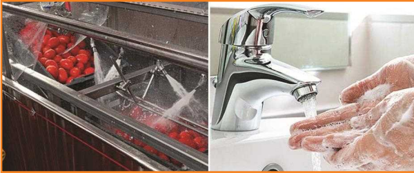
شکل ۲۳- رعایت نکات بهداشتی در عملیات پس از برداشت گوجه فرنگی