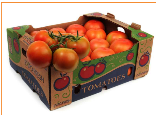
شکل ۱۲- استفاده از کارتن در بسته بندی گوجه فرنگی

از لبه بالای جعبه خالی بماند تا اطمینان حاصل شود که وزن جعبه بالایی روی گوجه فرنگی ها وارد نمی شود. به عبارت ساده تر سطح گوجه درون جعبه باید کمی پایین تر از لبه جعبه باشد.