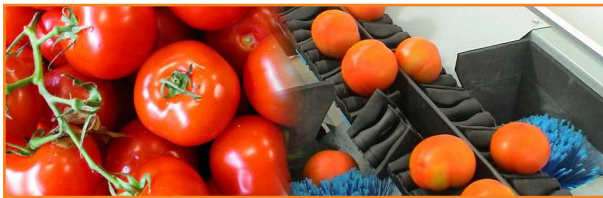
شکل ۶- واکس زنی گوجه فرنگی

یکی دیگر از مراحل آماده سازی محصول گوجه فرنگی برای عرضه به بازار استفاده پوشش نازکی از پوشش ها یا واکس های خوراکی قابل تجزیه است که می تواند در مرحله نهایی فرایند شست و شو روی محصول به کار رود. واکس زنی یا پوشش دهی میوه ظاهر آن را بهبود می بخشد و در خشندهی میوه را افزایش می دهد (شکل ۶). واکس زنی سبب کاهش پژمردگی میوه و افزایش ماندگاری محصول می شود (شکل ۷). واکس زنی همچنین سبب افزایش لغزندگی در سطح میوه و کاهش صدمات ناشی از سایش محصول در حین حمل و نقل می شود. باید از رسوب زیاد واکس در زخم های بنیادی جلوگیری کرد، زیرا تأثیر نامناسبی بر فرایند رسیدن خواهد داشت. واکس مورد استفاده برای گوجه فرنگی باید از نوع خوراکی و از موم های گیاهی نظیر کاندلیلا یا صمغ حشرات مانند شلاک یا موم زنبور عسل باشد. معمولاً پوشش دادن گوجه فرنگی در ایران انجام نمی شود.