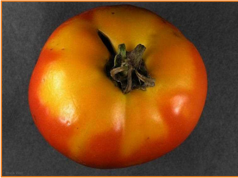
شکل ۹- شانه زرد نوعی اختلال رایج در رسیدگی برخی ارقام است.

همچنین میوه‌ها باید شکل یکنواخت مربوط به آن رقم را داشته باشند. میوه‌های بد شکل یا در اصطلاح صورت گربه‌ای ۱ باید جدا شوند و برای عرضه و به ویژه به منظور صادرات بسته بندی نشوند (شکل ۱۰).