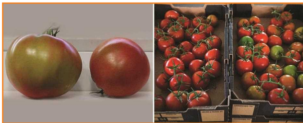
شکل ۸- میوه های گوجه فرنگی با درجات مختلف رسیدگی و اندازه های متفاوت نباید در یک جعبه قرار داده شوند.

برای جذب و جلب توجه مشتری لازم است گوجه فرنگی هایی با رنگی یکنواخت در داخل هر جعبه قرار داده شوند. معمولاً مشتری علاقه ای به وجود رنگ های مختلف میوه در داخل یک جعبه ندارد (شکل ۸).