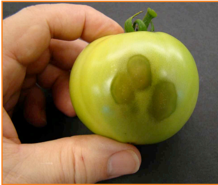
شکل ۱۶- فساد نرم باکتریایی ایجاد شده در گوجه فرنگی

بنیادی گوجه فرنگی در تانک های شست و شو که آب آن ها گرم نشده است، وارد میوه شوند. محل های آلوده در ابتدا نرم و کمی فرورفته به نظر می رسند. در لبه های محل آلودگی حالت خیس یا آب گرفته مشاهده می شود. ایجاد فساد در دمای اتاق سریع بوده و پوست ممکن است ترک بخورد و نشت آب از میوه آلوده مشاهده شود. بافت نرم و خمیری میوه فاسد شده بوی نامطبوعی ایجاد می کند.