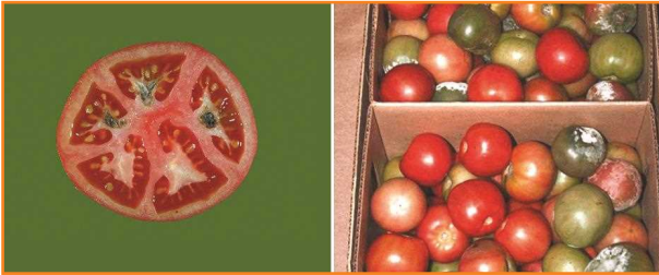
شکل ۱۸- فساد فیتوفترا در گوجه فرنگی