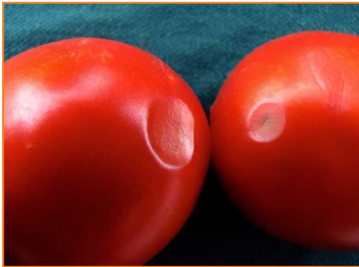
شکل ۲۱- فساد آنتراکنوز گوجه فرنگی

بیماری آلوده شوند، ولی هیچ گونه نشانه مشخصی را تا زمان رسیدگی نشان نمی دهند. بیماری غالباً به میوه های رسیده حمله می کند. در ابتدا، میوه های آلوده لکه های کوچک، کمی آبکی و فرورفته را نشان می دهند (شکل ۲۱). سپس این لکه ها بزرگ و مرطوب و تیره تر می شوند، فرورفتگی بیش تری پیدا می کنند و به صورت حلقه های متمرکز در می آیند. در هوای مرطوب قارچ های صورتی رنگ روی سطح میوه دیده می شوند. در شرایط گرم و مرطوب، قارچ به داخل میوه نفوذ می کند و آن را تخریب می کند. برای کنترل این بیماری باید از بذرهای عاری از بیماری، خاک بازهکش خوب، تناوب گیاهی و قارچ کش مناسب در مزرعه استفاده کرد و دقت کرد که از سرمازدگی میوه پس از برداشت جلوگیری شود.