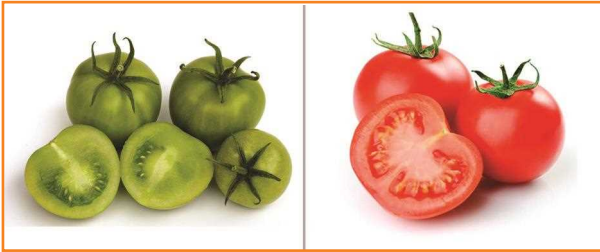
شکل ۱۴- تأثیر اتیلن بر رسیدن و تغییر رنگ میوه گوجه فرنگی، تیمار اتیلن (سمت راست) و نمونه کنترل (سمت چپ)

باید دقت داشت که تجمع گاز اتیلن در هوای انبار می تواند مشکلاتی را ایجاد کند و سبب تسریع در رسیدن میوه و واکنش های ناخواسته شود. به علاوه کنترل رسیدگی گوجه فرنگی در زنجیره توزیع در موارد زیادی حائز اهمیت است. یکی از روش های کنترل و به تعویق انداختن رسیدگی گوجه فرنگی، استفاده از تنظیم کننده رشد ۱- متیل سیکلوپروپن است. کاربرد یک میکرولیتر در لیتر از این ماده، اثر اتیلن موجود در محیط گوجه فرنگی را به شکل مناسبی کنترل می کند و رسیدگی محصول را به تأخیر می اندازد.