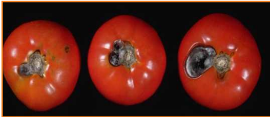
شکل ۱۷- گوجه فرنگی های آلوده شده با فساد آلترناریا

میوه های سالم که در شرایط خوب رشد کرده اند و به طرز صحیحی پس از برداشت نگهداری شده اند، حمله نمی کند. آلودگی از طریق آسیب های ایجاد شده توسط حشرات، ترک های موجود در زخم های بنیادی و بافت تضعیف شده در نتیجه آفتاب سوختگی، سرمازدگی یا رسیدن بیش از حد اتفاق می افتد.