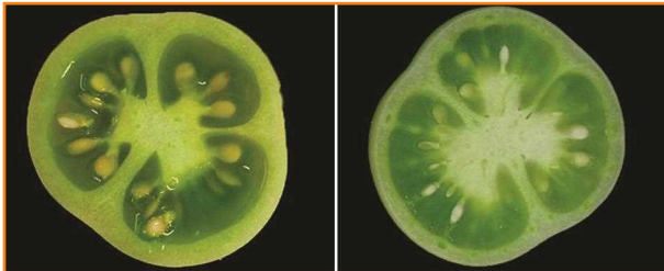
شکل ۲- تشکیل بذر و حفره ژل در میوه سبز نارس (سمت راست) و میوه سبز رسیده (سمت چپ)

از این خصوصیات درونی برای تعیین رسیدگی میوه های سبز با اندازه های متفاوت استفاده می کنند و فرض می شود که همه میوه های سبز با اندازه مشابه از نقاطی روی بوته که دارای بلوغ یکسان هستند، برداشت شده اند. بر این اساس میوه های سبز بالغ را می توان بر اساس اندازه برداشت کرد. افرادی که میوه را برداشت می کنند، باید برای تعیین بلوغ برداشت و جلوگیری از چیدن میوه های سبز نابالغ آموزش داده شوند. کیفیت و طعم میوه های سبز نابالغ برداشت شده کم تر است و باید از برداشت این میوه ها خودداری کرد. مرحله بلوغ برداشت بستگی به بازار مقصد و زمان لازم به رساندن محصول به بازار دارد. گوجه فرنگی هایی که در بازار محلی به فروش می رسند، برای آنکه به مدت یک هفته یا بیش تر بتوان آن ها را نگهداری کرد، باید در مرحله دگرگونی برداشت شوند یا آنکه بر اساس ارجحیت مصرف کننده مدت زمان بیش تری روی بوته باقی بمانند.