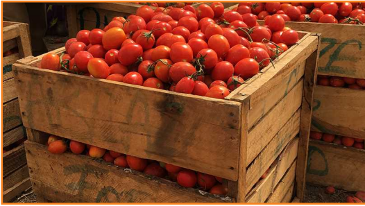
شکل ۱۱- جعبه های چوبی نامناسب که بیش از حد پر شده‌اند.

گوجه فرنگی های سبز بالغ که برای صادرات درجه بندی شده اند، باید آزادانه در کارتن های مقوایی با تهویه مناسب قرار گیرند که لازم است در این خصوص به موارد زیر توجه کرد: ◀ حداکثر وزن این جعبه ها حدود ۱۱ کیلوگرم است؛ ◀ ابعاد کارتن ها نیز 24 \times 40 \times 30 سانتی متر مکعب باشد؛ ◀ باید کارتن ها حداقل تست فشار ۲۷۵ پوند بر اینچ مربع را تحمل کنند.