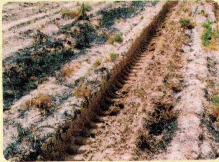
شکل ۱ - تراکم خاک حاصل از تردد ماشین‌های کشاورزی

برگردان دار انجام می‌شود و عمق شخم نیز معمولاً ثابت است، در طی سالیان سال لایه‌های زیرین خاک فشرده شده و در نهایت پس از چند سال، لایه متراکمی (Plow Pan) در کف شیار شخم ایجاد می‌گردد. لذا جهت جلوگیری از تشکیل لایه متراکم فوق بهتر است عمق شخم به طور سالیانه تغییر یابد.