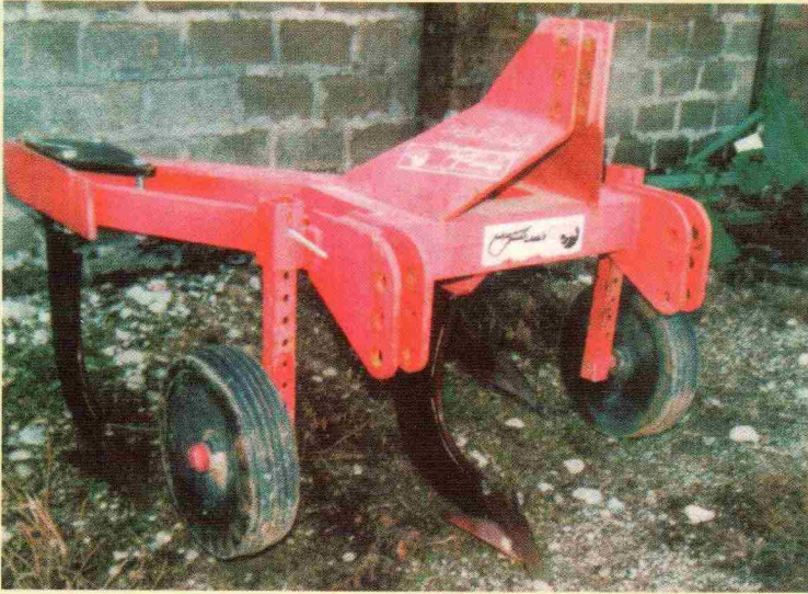
شکل ۳- زیرشکن با تیغه بالهدار

کف بسیار شخم می‌باشند و در محدوده عمق ۵۰-۲۵ سانتیمتر تشکیل می‌گردند، لذا بهتر است از به کارگیری زیرشکن در عمق‌های بیشتر از ۵۰ سانتیمتر، بدون نظر کارشناسان صاحب نظر خودداری گردد. عمق زیرشکنی خاک معمولاً ۳۵-۳۰ سانتیمتر در نظر گرفته می‌شود که می‌تواند باعث شکسته شدن سخت‌لایه حاصل از کارکرد سالیانه گاواهن برگردان‌دار در یک عمق ثابت، گردد.