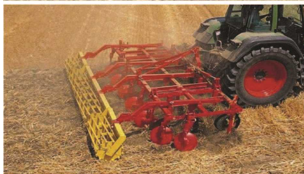
شکل ۱۲- خاک ورنز مرکب (چیزل با تیغه‌های پنجه‌غازی + دیسک + غلتک)