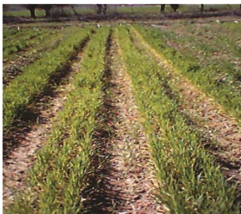
شکل ۶- سیستم کاشت روی پشته‌های بلند و عریض