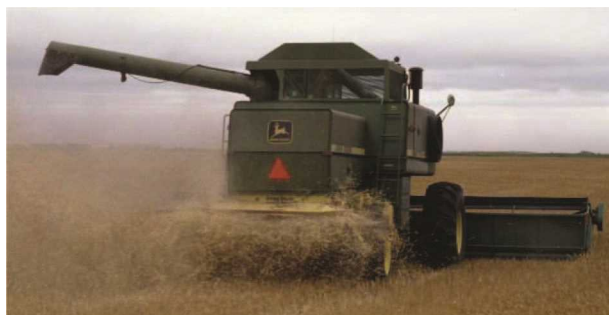
شکل ۳- کمباین مجهز به ساقه خردکن