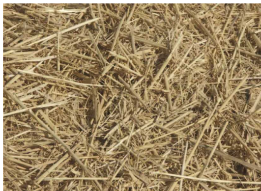
شکل ۵- باقی گذاشتن بقایای گیاهی در سطح مزرعه