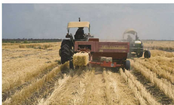
شکل ۴- جمع آوری بقایای گیاهی بوسیله بیلر

با توجه به شرایط اقلیمی در مناطق خشک و نیمه خشک و وجود مشکلاتی نظیر محدودیت منابع آب، فقیر بودن خاک‌های این مناطق از مواد آلی و آسیب‌پذیر بودن ساختمان آنها و معایب دیگر اشاره شده در استفاده از خاک‌ورزی مرسوم، لزوم توجه به خاک‌ورزی حفاظتی به عنوان یک سیستم جایگزین بایستی مورد توجه کشاورزان قرار گیرد.