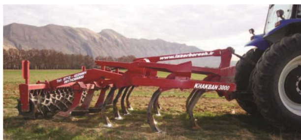
شکل ۹- دستگاه خاک ورز مرکب

در مزرعه انجام می‌گردد که باعث تخریب ساختمان خاک و تلفات زمانی جهت کاشت محصول بعدی می‌گردد.