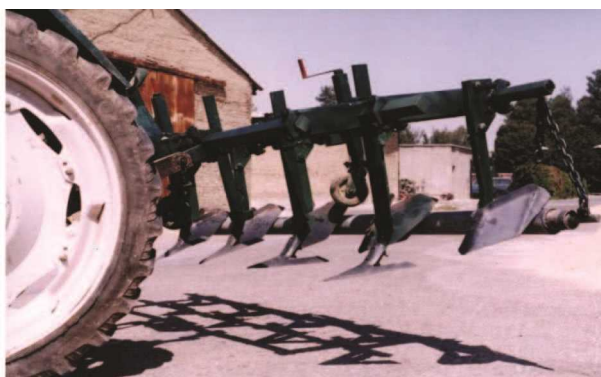
شکل ۷- خاک‌ورز مرکب مورد استفاده در روش کاشت روی پشته‌های بلند و عریض