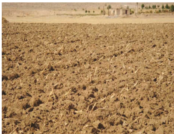
شکل ۲- مخلوط کردن بقایای گیاهی با خاک

قسمتی از بقایای گیاهی را از زمین خارج کرد. جهت این کار می‌توان حجم زیادی از بقایای گیاهی را که از پشت کمباین به روی سطح مزرعه می‌ریزد را بوسیله بیلر جمع‌آوری و سپس از مزرعه خارج نمود (شکل ۴). از مزایای مخلوط کردن بقایای گیاهی با خاک ورزی مرسوم، افزایش درصد ماده آلی خاک، حفظ رطوبت خاک، افزایش دور آبیاری و جلوگیری از آلودگی محیط زیست است و از معایب این سیستم می‌توان به تردد زیاد ماشین‌های کشاورزی در مزرعه، افزایش هزینه خاک ورزی جهت تهیه بستر بذر و زمان طولانی مورد نیاز جهت تهیه بستر بذر اشاره نمود (بوژه جهت کشت‌های متوالی که زمان کمی جهت تهیه بستر بذر وجود دارد).