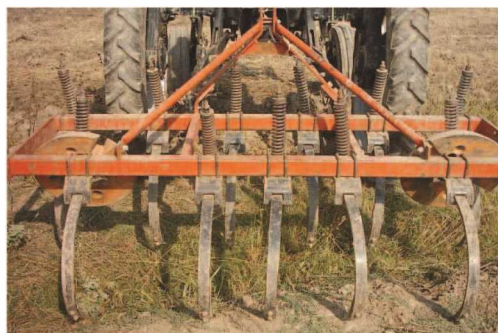
شکل ۱۳- گاواهن چیزل با تیغه‌های قلمی