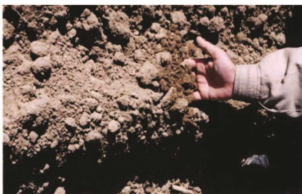
شکل ۸- تهیه بستر مناسب بذر در بعد از استفاده از خاک‌ورز مرکب در روش نم کاری