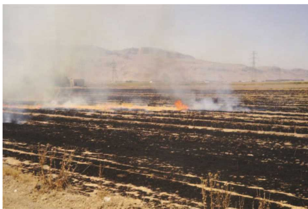
شکل ۱- سوزاندن بقایای گیاهی محصول قبل در مزرعه