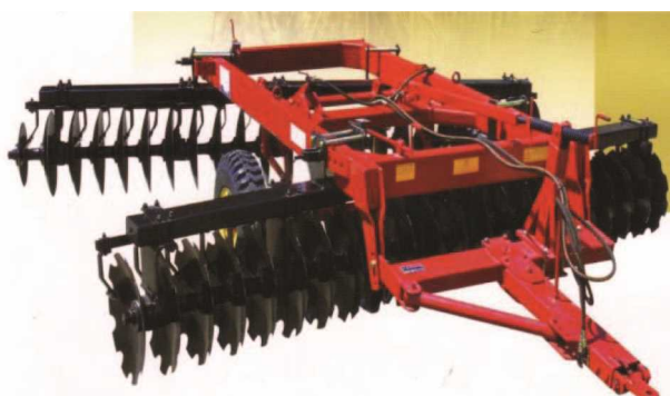
شکل ۱۴- دیسک سنگین