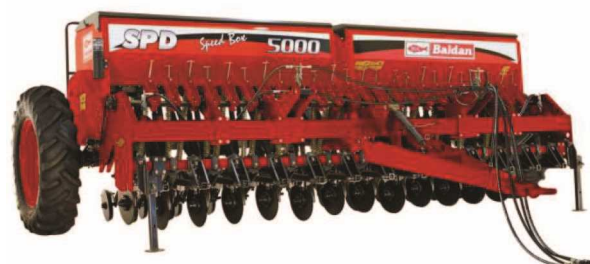
شکل ۱۰- نمایی از دستگاه کشت مستقیم بلدان مدل ۵۰۰۰

خاک‌ورزهای مرکب (شکل ۱۱ و ۱۲)، گاو آهن قلمی (شکل ۱۳)، دیسک‌ها (شکل ۱۴) به دلیل عرض کار بیشتر و عمق کار کمتر از جمله ماشین‌های مورد نیاز برای اجرای روش‌های خاک‌ورزی حفاظتی با توجه به نوع خاک و شرایط اقلیمی مورد نظر می‌باشند. ترکیب ادوات خاک‌ورزی مرکب را می‌توان مطابق با شرایط خاک منطقه انتخاب و بکار گرفت. بعنوان مثال: کاربرد گاو آهن‌های قلمی، دیسک‌ها بصورت دوبار عمود برهم و کاربرد خاک‌ورزهای مرکب (چیزل با تیغه‌های قلمی یا پنجه غازی + دیسک یا بدون دیسک + غلتک) در این گونه موارد توصیه می‌گردد.