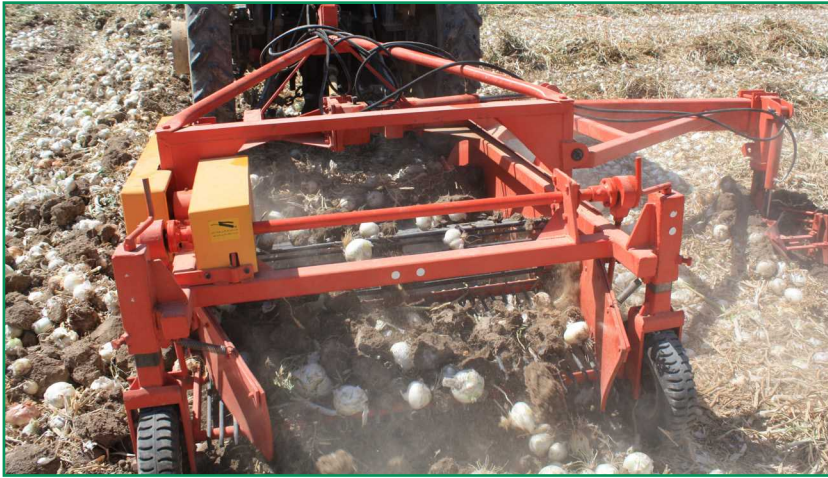
شکل ۶- پیازکن غربال دار برای کندن پیاز در کشت درهم

هم متفاوت اند. در یک الگو از ماشین‌های برداشت غربال دار، یک ماشین برگ‌زن به جلو تراکتور متصل می‌شود و در پشت تراکتور یک ماشین پیازکن قرار دارد که برداشت یک مرحله‌ای در یک تردد را امکان‌پذیر می‌کند.