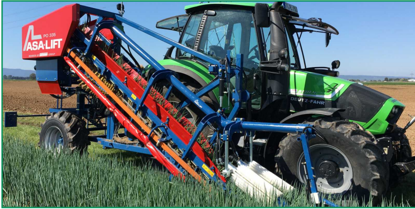
شکل ۱- کمباین پیاز مجهز به تسمه‌های بالابر