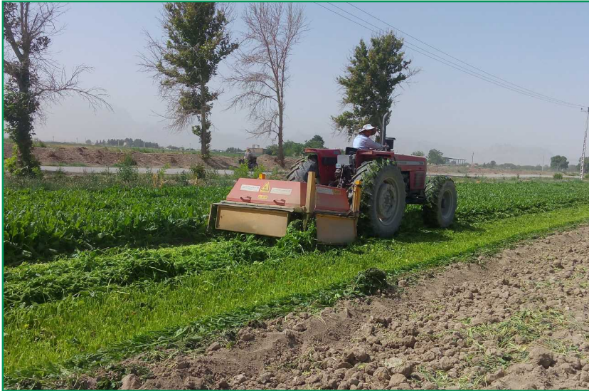
شکل ۲- ماشین برگ‌زن تیغه‌ای در حین عملیات برگ‌زنی

(مجهز به سنسور ارتفاع برش) را دارد. در این ماشین از یک هواکش برای ایجاد مکش و عمود نگه داشتن برگ‌های پیاز در زمان برش برگ‌ها استفاده شده است. از این ماشین در برداشت یک مرحله‌ای (عملیات کندن هم‌زمان با برگ‌زنی) و یا دو مرحله‌ای (عملیات کندن با فاصله زمانی چند روزه بعد از برگ‌زنی) استفاده می‌شود.