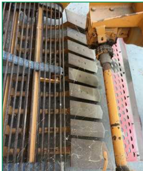
شکل ۷- تیغه سراسری در پیازکن