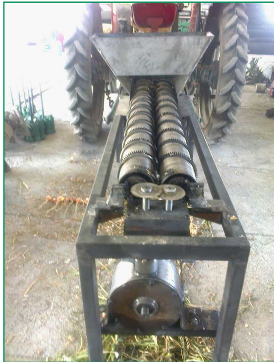
شکل ۳- ماشین برگ‌زن غلطکی پیاز

قرار می‌گیرند تا فرایند رسیدگی کامل یا خشک شدن در آن‌ها انجام شود. در این شرایط برای عملیات برگ‌زنی، غده‌های پیاز به همراه قسمت سبزینه (برگ) روی ماشین برگ‌زن قرار داده می‌شوند و از دو غلطک مجهز به زائده‌های لاستیکی و نوار مارپیچ فلزی و یک تیغه برش چرخان استفاده می‌شود که غلطک‌ها دارای سرعت دورانی یکسان و خلاف جهت یکدیگر هستند. به محض قرار گرفتن غده‌ها روی غلطک، ضمن حرکت به جلوی غده‌ها توسط مارپیچ انتقال، برگ پیاز با زائده‌های لاستیکی دور غلطک تماس پیدا می‌کند و از فاصله بین دو غلطک به پایین کشیده می‌شوند. بر اثر چرخش تیغه چرخان برگ‌ها بریده می‌شوند. غده‌ها به علت قطر بیش‌تر در فاصله بین دو غلطک قرار می‌گیرند و توسط مارپیچ انتقال به انتهای دستگاه برای جمع‌آوری منتقل می‌شوند (شکل ۳).