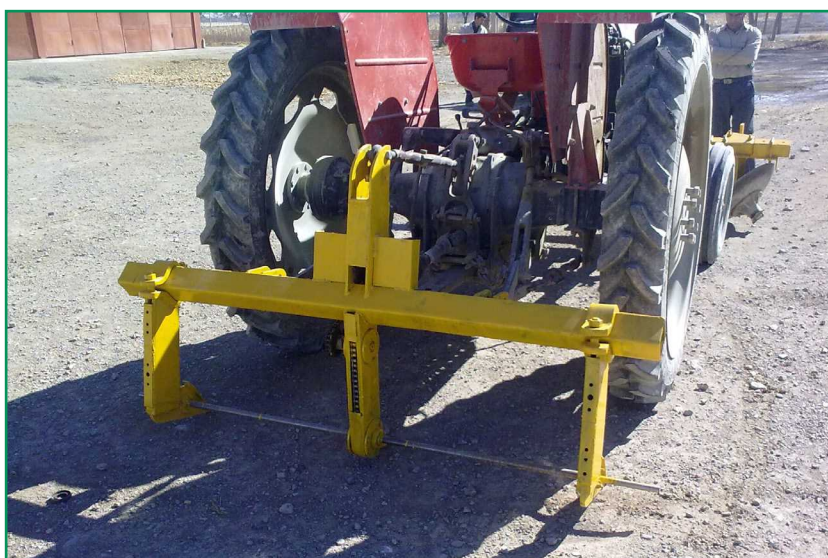
شکل ۱۰- پیازکن میله‌ای در اتصال به تراکتور