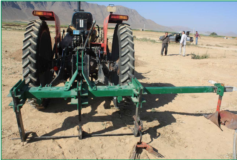
شکل ۱۱- پیازکن تیغه‌ای

این پیازکن همانند پیازکن میله‌ای فاقد سیستم غربال‌کنندگی است. روش کندن پیاز در این ماشین مانند پیازکن میله‌ای است، با این تفاوت که در این ماشین به جای میله از یک تیغه ثابت سراسری برای کندن پیاز استفاده شده است (شکل ۱۱). این تیغه ثابت سراسری دارای عرض ۸ و طول ۱۵۰ سانتی‌متر و زاویه جلوسو ۱۵ درجه‌ای است و همانند پیازکن میله‌ای توسط سه بازوی حامل، با حرکت به جلو تراکتور عمل نفوذ در خاک و کندن و زیر برکردن ریشه پیاز را انجام می‌دهد. بازوهای حامل مجهز به تیغه‌های جلوسو است که در خاک نفوذ می‌کند و هدایت تیغه سراسری به زیر غده‌های پیاز را انجام می‌دهد. تیغه سراسری در مقرهای تعبیه شده در بازوهای حامل به صورت کشویی قرار گرفته و تعویض آن به راحتی امکان‌پذیر است. در ماشین نمایش داده شده (شکل ۱۲) واحد کنارسوار با اتصال لولایی به شاسی اصلی متصل است و بالا و پایین بردن شاسی ردیف‌کن در ابتدا و خاتمه هر عبور برداشت به صورت دستی انجام می‌شود.