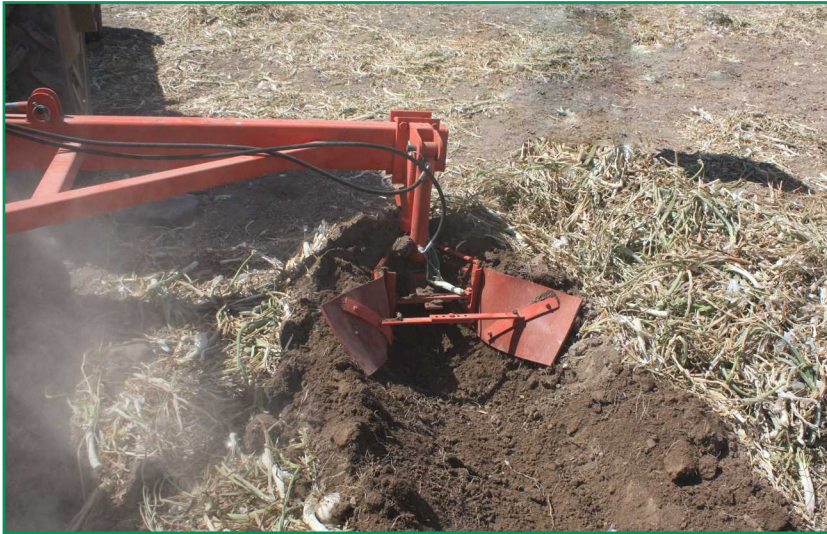
شکل ۴- واحد کنارسوار در پیاز کن‌های عقب سوار

قرار گرفته‌اند. این ماشین‌ها همان ماشین‌های استفاده شده در کشت ردیفی هستند با این تفاوت که مجهز به واحد کنارسوار هستند.