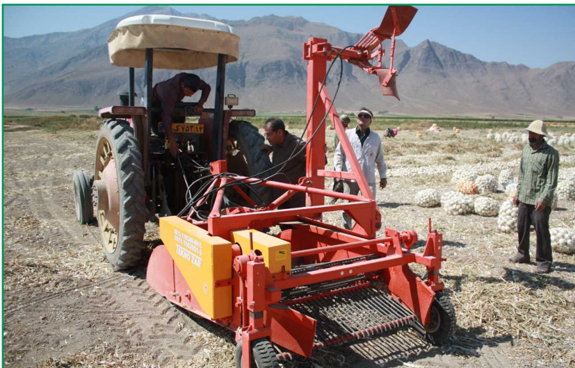
شکل ۵- واحد کنارسوار در حالت حمل و نقل