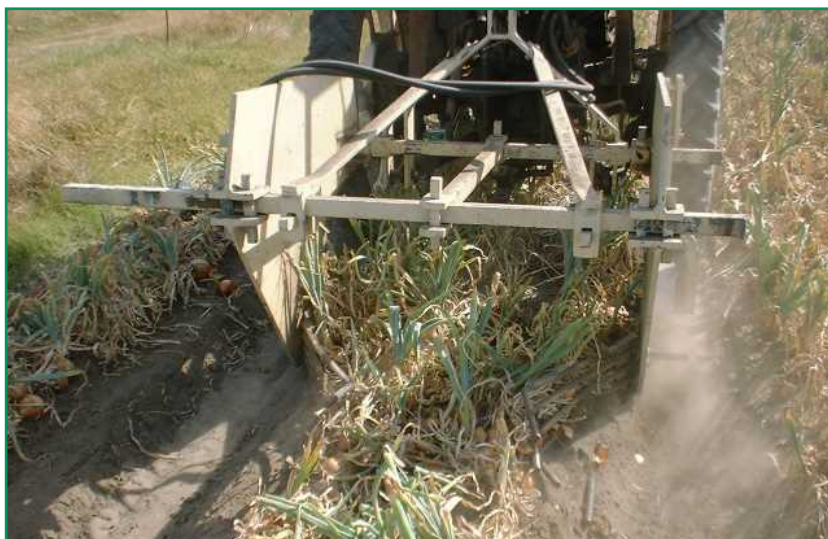
شکل ۹- پیازکن میله‌ای در برداشت دومرحله‌ای

پیاز از خاک اطراف آن می‌شود. با توجه به ناتوانی میله به نفوذ در داخل خاک از اضافه کردن وزنه‌های استاندارد بر روی شاسی استفاده شده است.