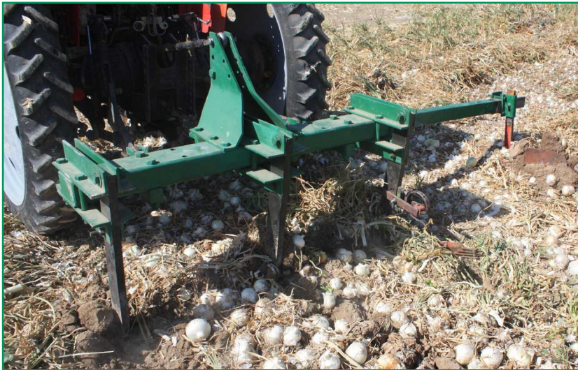
شکل ۱۲- پیازکن تیغه‌ای در حین عملیات پیازکنی